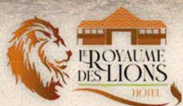
HOTEL ROYAUME DES LIONS