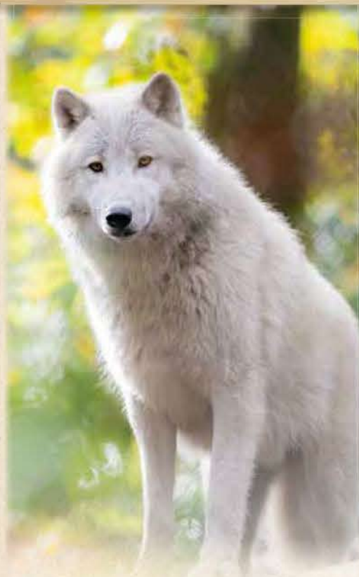
LE VILLAGE DU GRAND NORD