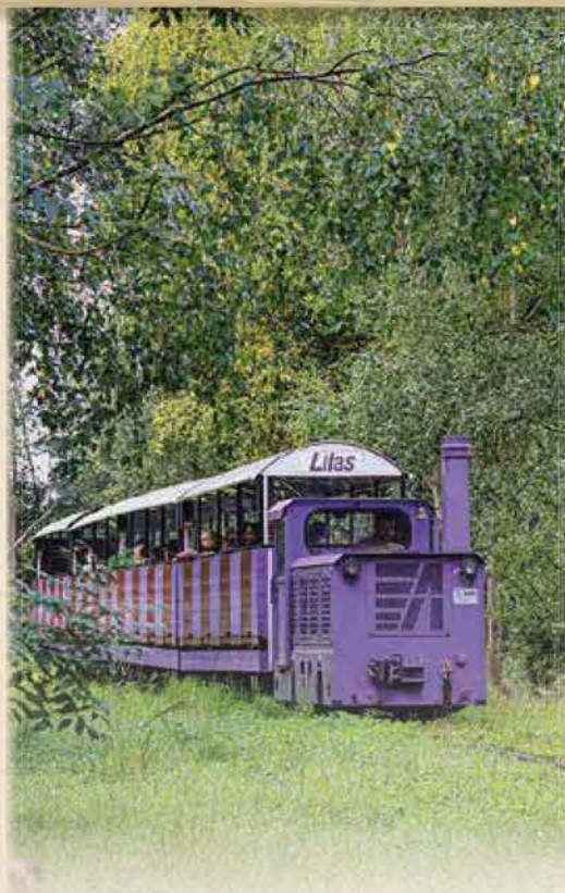
SAFARI TRAIN MINI FERME